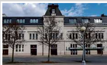
Multifunkční budova, Brno

Koncern e-Finance, a.s. v současnosti spravuje investice do nemovitostí v hodnotě přesahující 1 miliardu korun. Investiční strategií e-Finance je investovat prostředky získané z dluhopisů do nákupu a výstavby rezidenčních a komerčních nemovitostí v atraktivních lokalitách České republiky. Portfolio investic najdete na www.e-finance.eu .