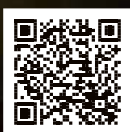
Nada Konvalinková.

MPOLZ MINISTERSTVO ZDRAVOTNICTVÍ ČESKÉ REPUBLIKY