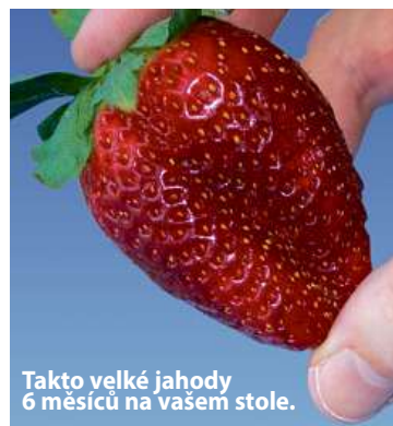
Takto velké jahody 6 měsíců na vašem stole.

Ano, nyní se již nepotřebujete ohýbat, abyste sbírali na zemi a v blátě jahody, které napadli živočišné ještě předtím, než byly zralé.