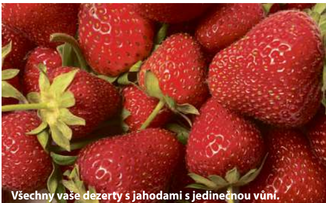
Všechny vaše dezerty s jahodami s jedinečnou vůní.