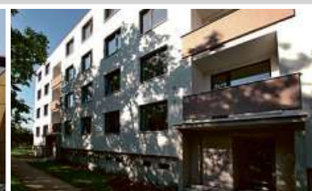
Bytový dům, Brno-Chrlice