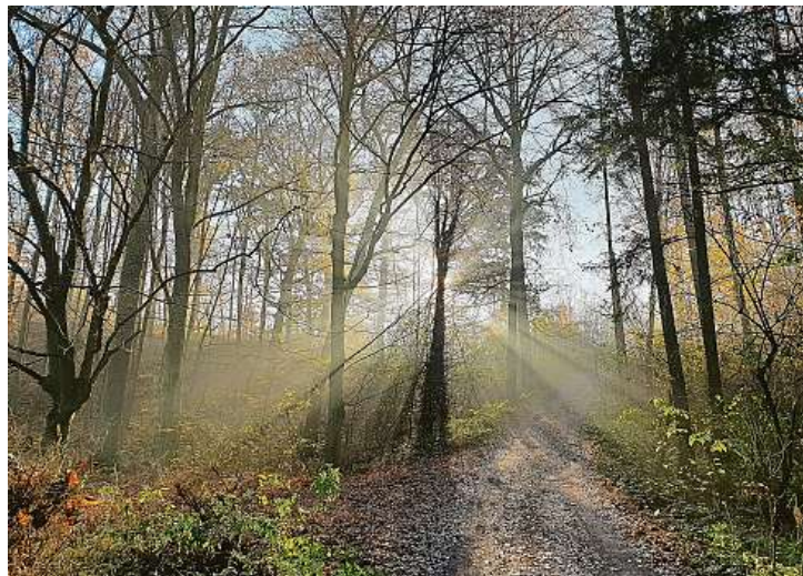
Okolí Zaječího potoka by se mohlo stát dalším oblíbeným cílem Brňanů, kteří se chtějí vydat do přírody

Údolí, kde vzniká rekreační les, se nachází na severozápadě Brna. Odděluje známou oblast Kociánky, zástavbu v Sadové ulici, od sídliště Lesná. Jde o jed-