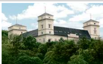
Zámek Račice, přestavba