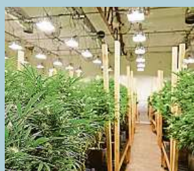
Pěstírna konopí.

Fakultní nemocnice u sv. Anny v Brně začala budovat vlastní pěstírnu konopí . Světově unikátní projekt má být dostavěn v půlce roku. Využívat ji budou vědci z Mezinárodního centra klinického výzkumu (FNUSA-ICRC). Podle odborníků jde o komplexní výzkum konopí od studia genetiky, obsahových látek až po nové aplikace při léčbě různých onemocnění.